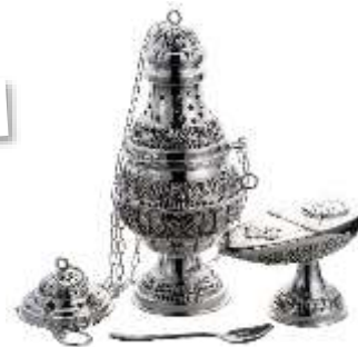
Weihrauchfass & «Schiffchen»