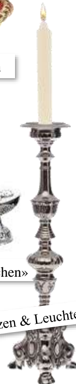
Kerzen & Leuchter