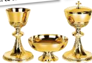
Kelch & Hostienschale